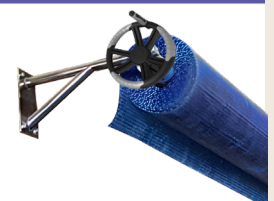
AMU3 et AMU4