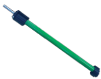
TT0 Pour enrouleur 3 et 4 mètres

Notre moteur est compatible avec ces enrouleurs uniquement