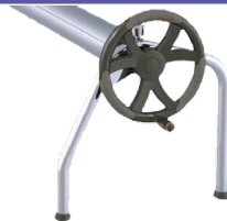
SP3 et SP4